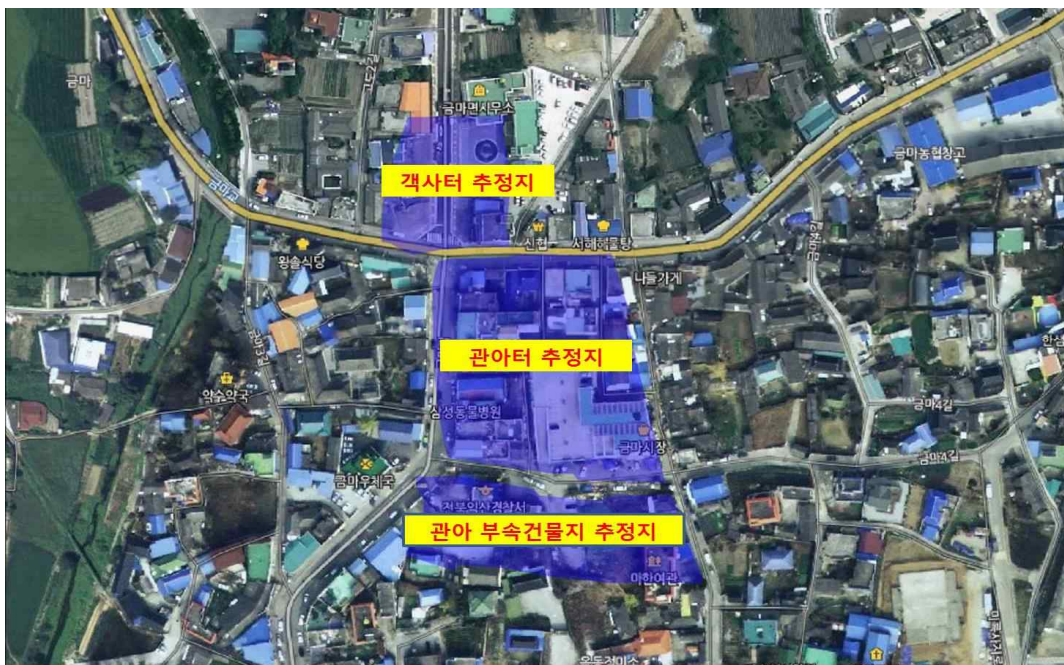
〈자료 2〉 추정 객사터와 관아터