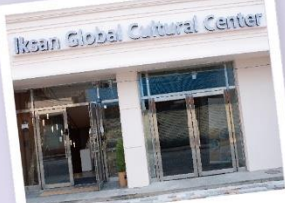
# 익산글로벌문화관 전경