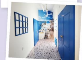
# 그리스 산토리니 포토존