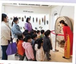
# 전시관 관람중