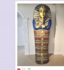
# 이집트 투탕카멘

세계 전시품(가면, 악기, 의상, 인형, 조형물 등)을 직접 볼 수 있고, 전통의상을 입고 포토존에서 기념 촬영을 할 수 있습니다.