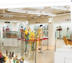
# 전시관 전경