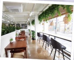
# 글로벌 식당