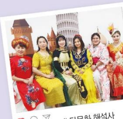
# 다문화 해설사