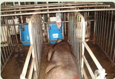
열린 페트병을 활용 점적관수