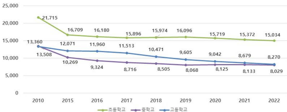
익산시 학생 수 미래 변동 추이