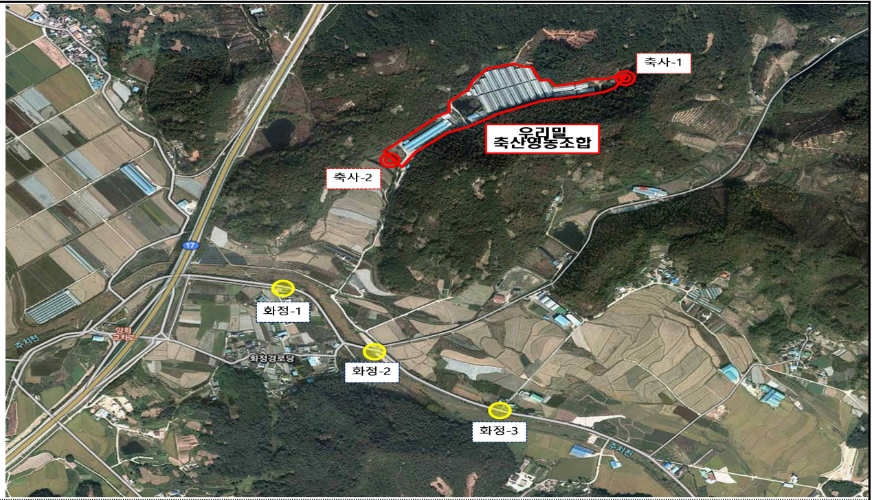
완주 우리밀 축산영농조합